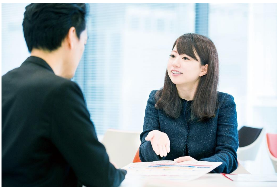
※第一生命の営業員による対面での商品紹介イメージ

アイペット損害保険株式会社（本社所在地：東京都港区、代表取締役社長：山村鉄平 以下、当社）は、第一生命保険株式会社（本社所在地：東京都千代田区、代表取締役社長：稲垣精二、以下「第一生命」）と代理店契約を締結し、2019年10月1日より、第一生命の営業員（以下、生涯設計デザイナー）によるペット保険販売を開始します。これは、本年2月1日に発表しました、第一生命ホールディングス株式会社（代表取締役社長：稲垣精二 以下、第一生命ホールディングス）との業務提携に基づく両社の取組みとして実施するものです。