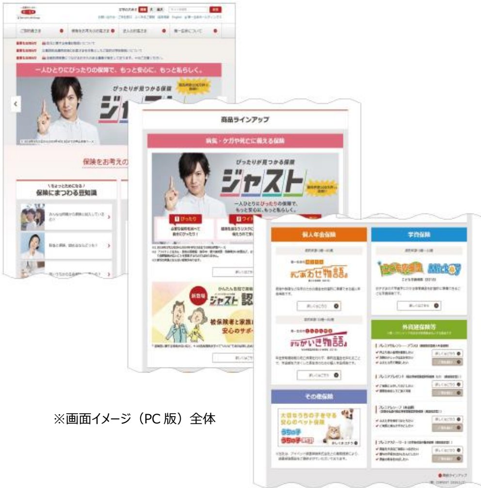
※画面イメージ (PC版) 全体