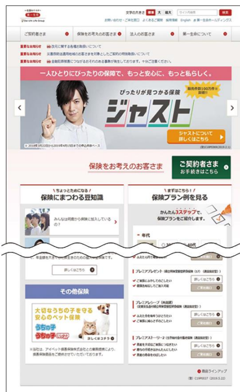
※画面イメージ（PC版）一部